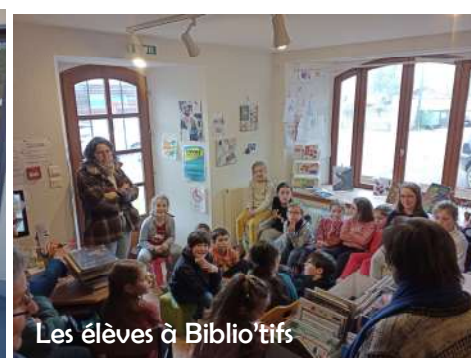
Les élèves à Biblio'tifs