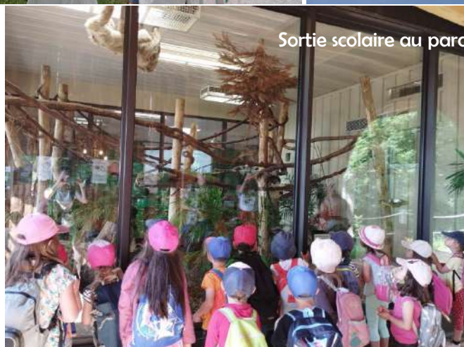
Sortie scolaire au parc animalier d'Ardes-sur-Couze