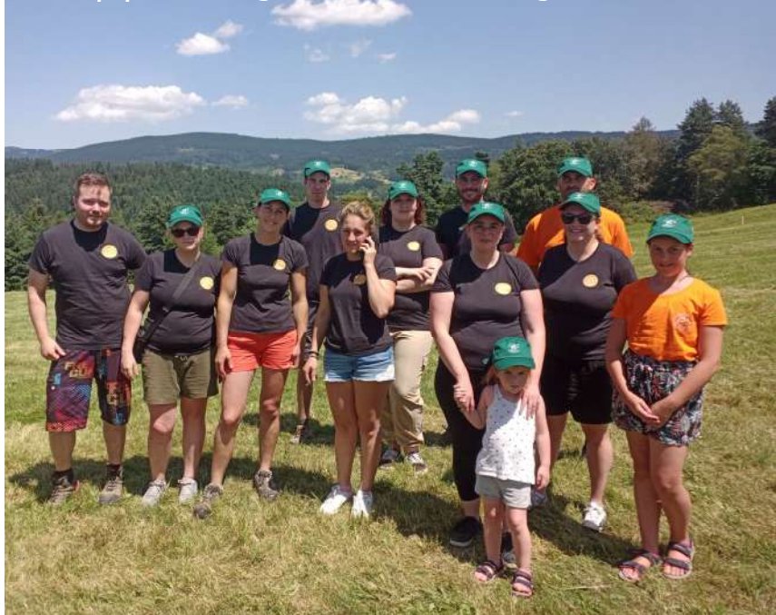
L'équipe de Bertignat aux Jeux Intervillages de Saint-Just

Le Comité des Fêtes de Bertignat organise sa fête patronale du 15 au 17 septembre 2023.