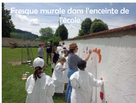
Fresque murale dans l'enceinte de l'école