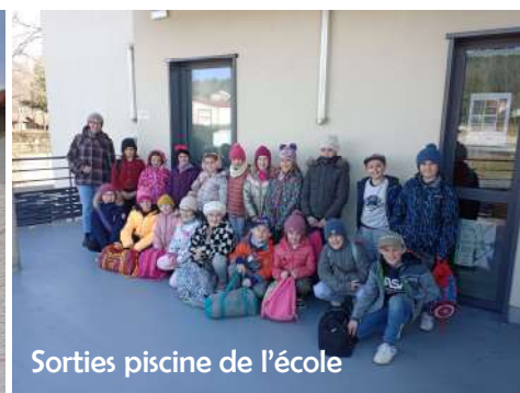
Sorties piscine de l'école